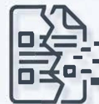
Fuga de Datos